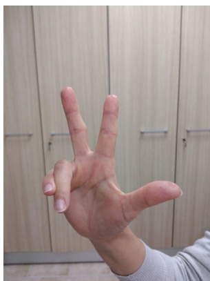
Due dita dormono