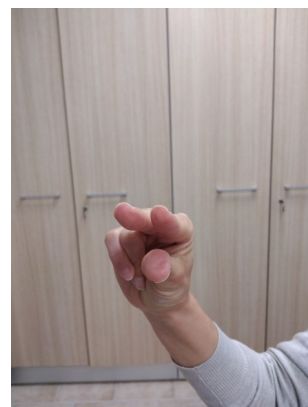
Tre prendono la matita